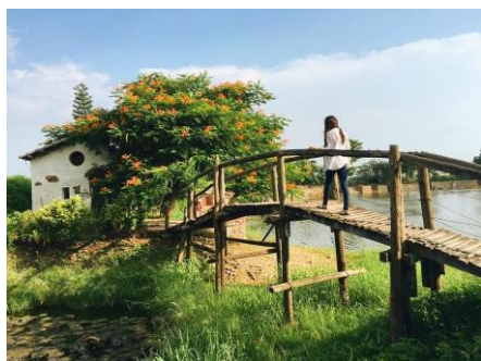
07~09 台南市的老塘湖藝術村(橋)_水彩8開 (日期：預計 12/13 起，未定，學費：$1,200)