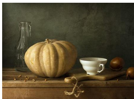
10~12 有南瓜的靜物_水彩8開 (日期：預計 12/13 起，未定，學費：$1,200)

游藝社幹事：廖慧如，Nereid.Liao@twgrid.org，電話：2789-8373