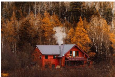
01~03 加拿大的秋天_水彩8開 (日期：預計 12/13 起，未定，學費：$1,200)