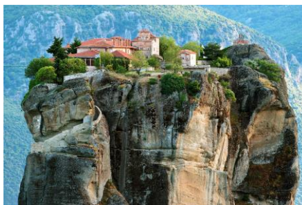
04~06 希臘的修道院_邁泰奧拉_水彩8開 (日期：預計 12/13 起，未定，學費：$1,200)